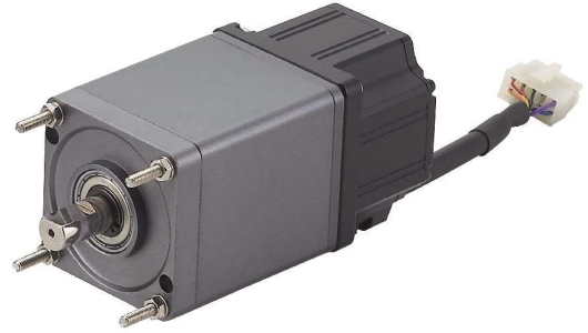
外形尺寸/ Appearance Size